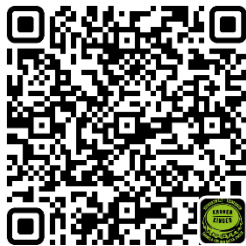
Annahmestellen - Map

Der Erlös und damit gleichzeitig Spendensumme waren bisher 28.378,63€ .